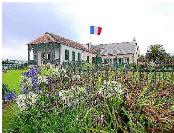
■ Longwood House, ultime demeure de Napoléon Ier, appartient désormais à la France.

Sans parler de la tombe, vide depuis 1840 et le retour des cendres aux Invalides, à