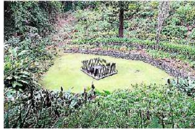
■ La tombe, vide depuis 1840, l'année du transfert des cendres.