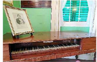
■ Le salon et ses volets percés par Napoléon pour observer...