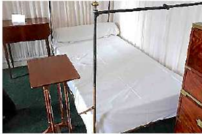
■ Le lit, aussi modeste que spartiate, de Napoléon.